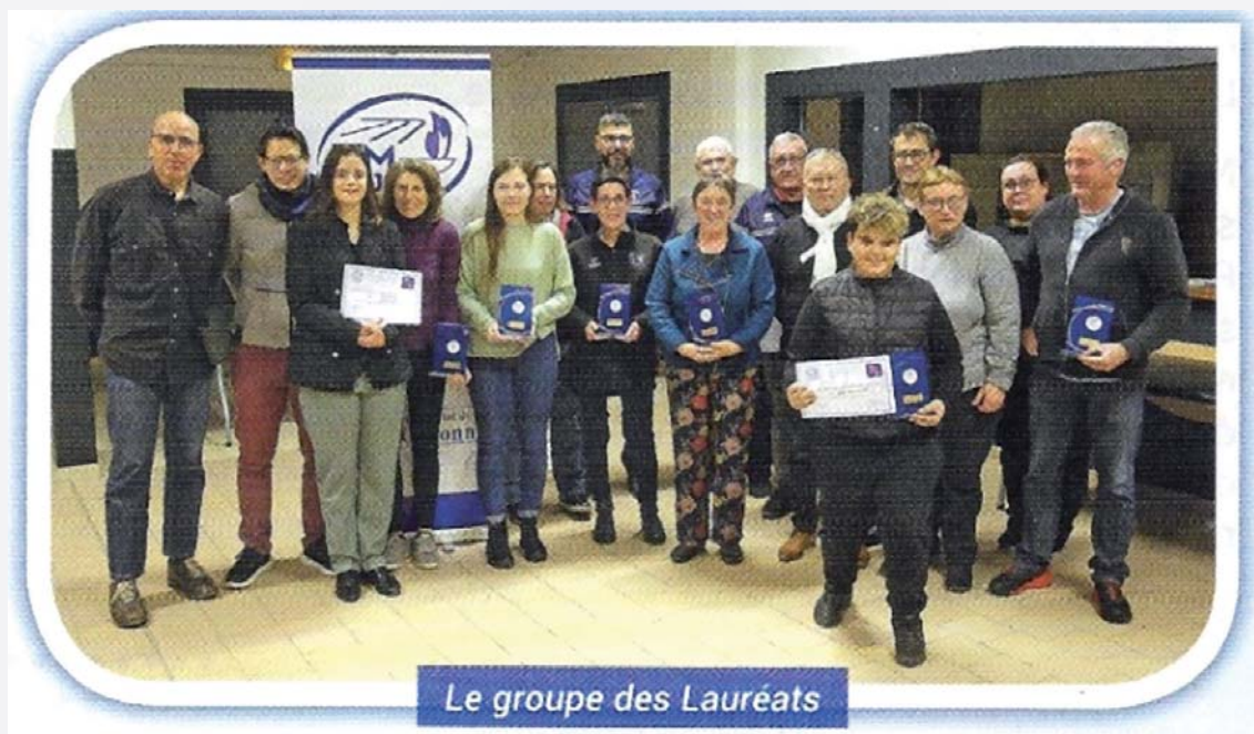
Le groupe des Lauréats

La soirée s'est poursuivie par un buffet en toute convivialité où chacun a pu féliciter les heureux lauréats.